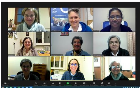
Session du 26 novembre 2020

Des travaux ont également été entrepris en vue d'élaborer un questionnaire destiné à recueillir des informations nous permettant d'avoir la « photo réelle » de la réalité des RJM et de la mission de chaque province/délégation de la Congrégation.